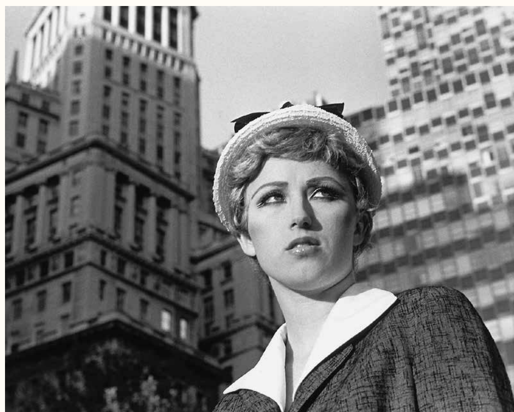
Cindy Sherman, Untitled Film Still #21 , 1978