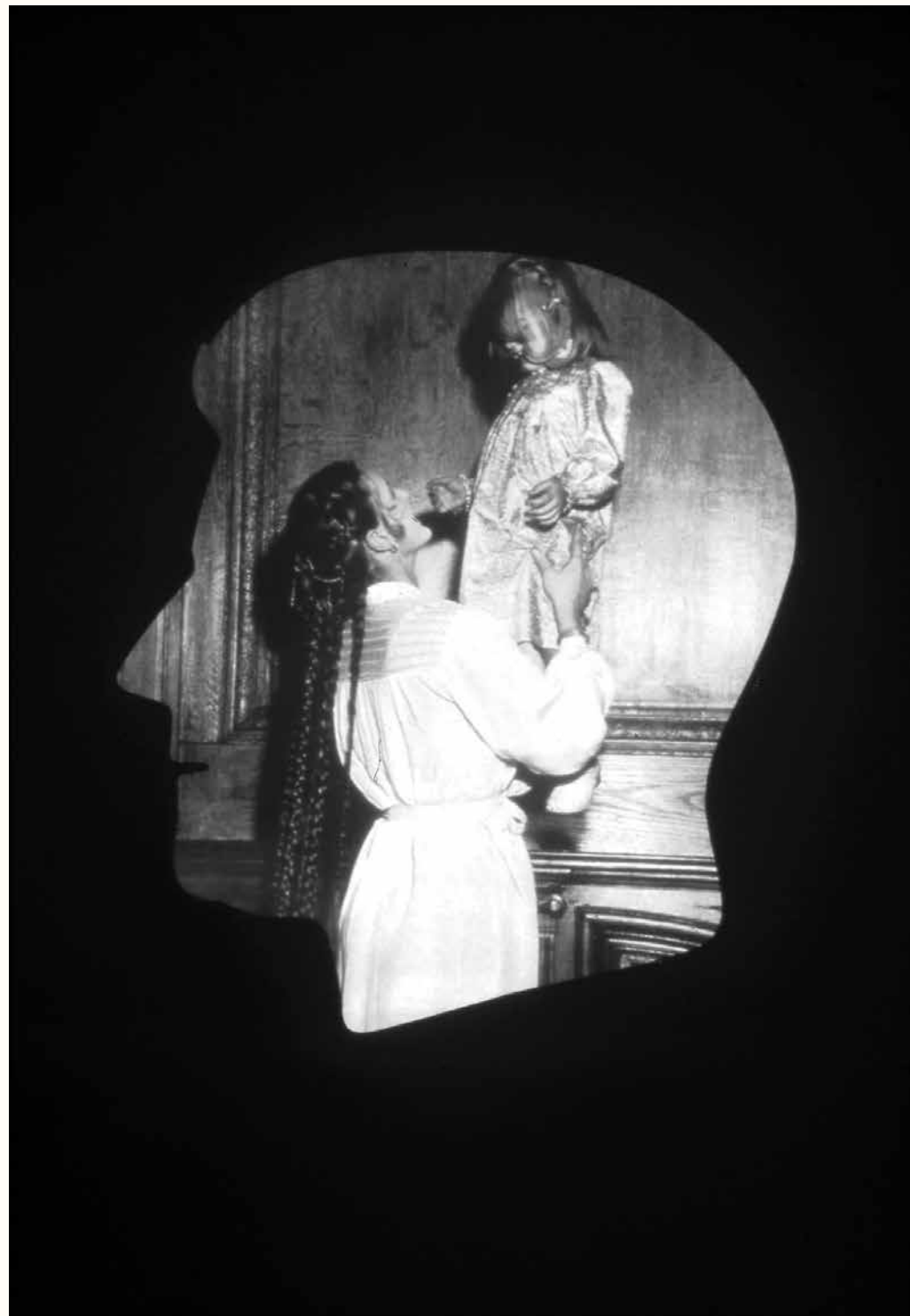
Sherrie Levine, Untitled (Presidential Profile) , 1979 (œuvre originale en couleur)